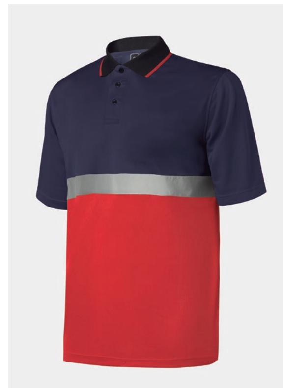
POLO HAUTE VISIBILITÉ BANDE RÉFLÉCHISSANTE SUR POITRINE