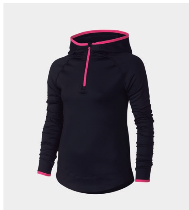
SWEAT-SHIRT PRÈS DE CORP