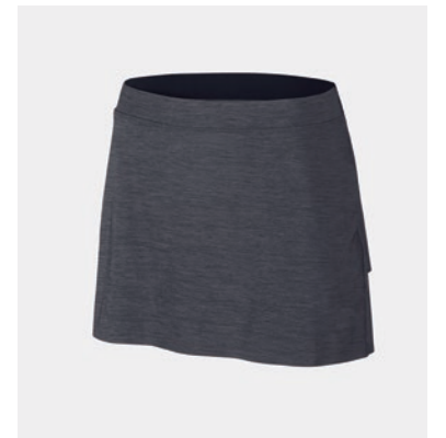
JUPE CEINTURE ÉLASTIQUE