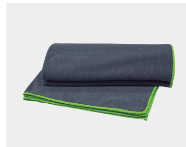
SERVLETTE DE BAIN SÉCHAGE RAPIDE. LISÉRÉ PERSONNALISÉ