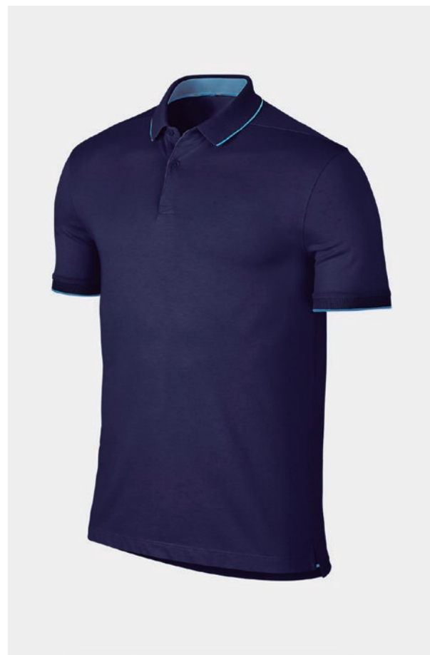
POLO FRANGES DE COULEUR PERSONNALISABLET