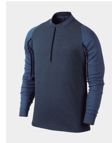
T-SHIRT BICOLORE T-SHIRT BICOLORE AVEC FERMETURE ÉCLAIR