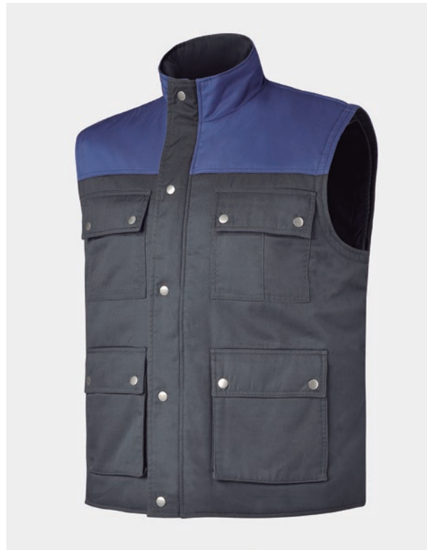
GILET DE TRAVAIL QUATRE POCHES. FERMETURE ÉCLAIR CACHE