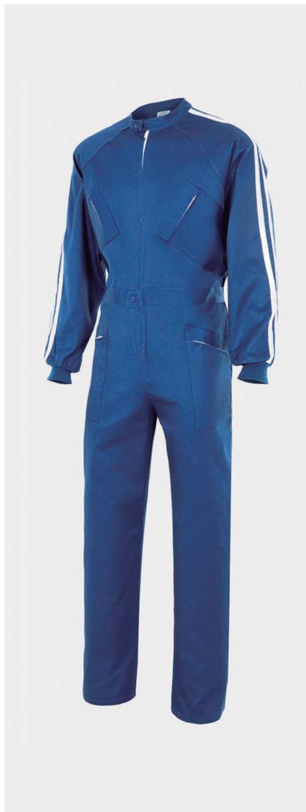
BLEU DE TRAVAIL AVEC MANCHES RAGLAN ÉLASTIQUE À L'INTÉRIEUR DE LA CEINTURE POSTÉRIEURE