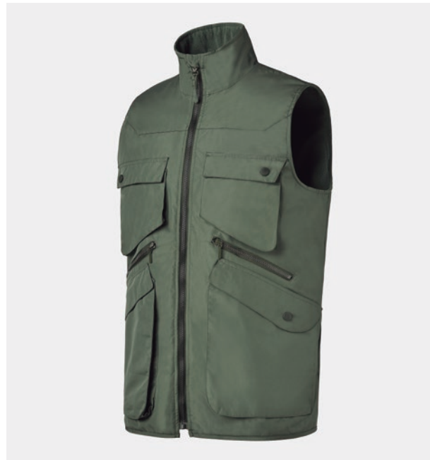
GILET SIX POCHES. PROTECTEUR DE MENTON