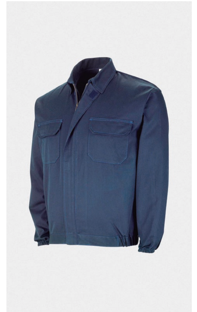
VESTE IGNIFUGE TISSU IGNIFUGE AVEC COUTURES EXTRARÉSISTANTES