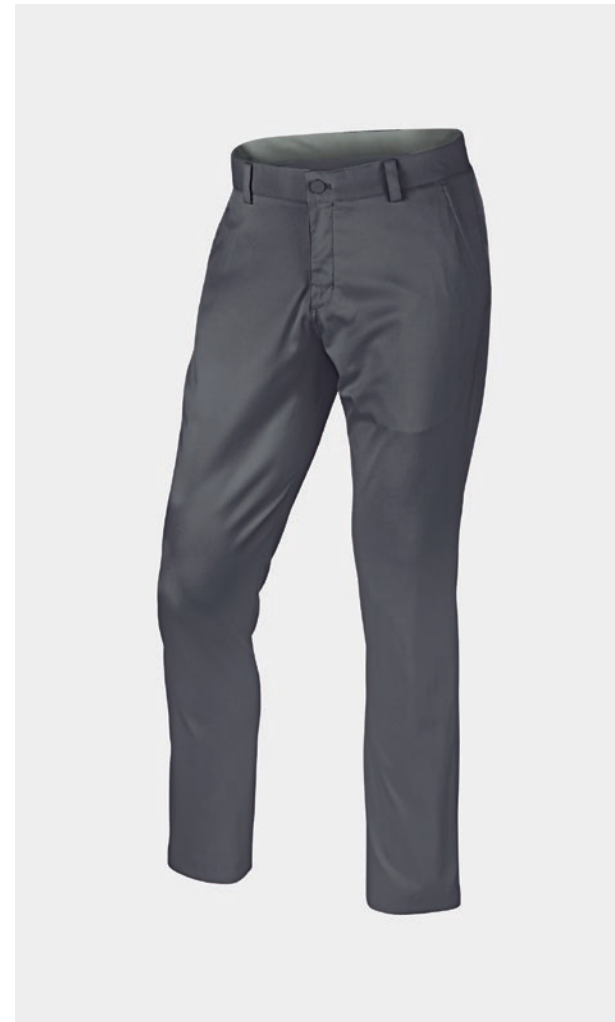
PANTALON CEINTURE SANS ÉLASTIQUE