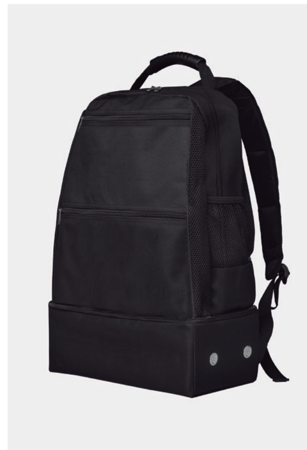
SAC A DOS IL PERMET DE TRANSPORTER DES CHAUSSURE