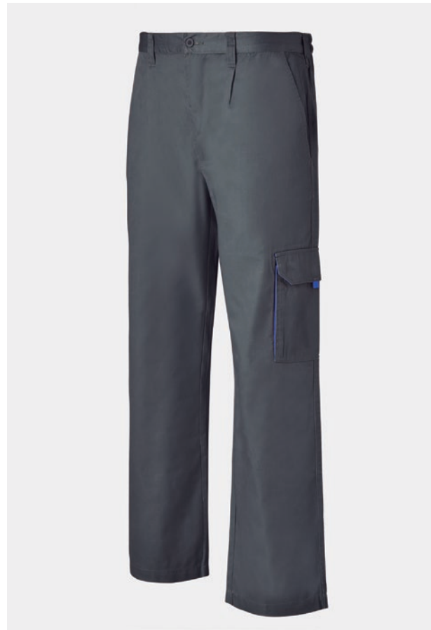
PANTALON PANTALON COUPE DROITE MULTIPOCHES