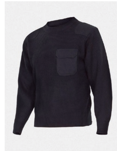
JERSEY PROTECTION SPÉCIALE CONTRE LE FROID