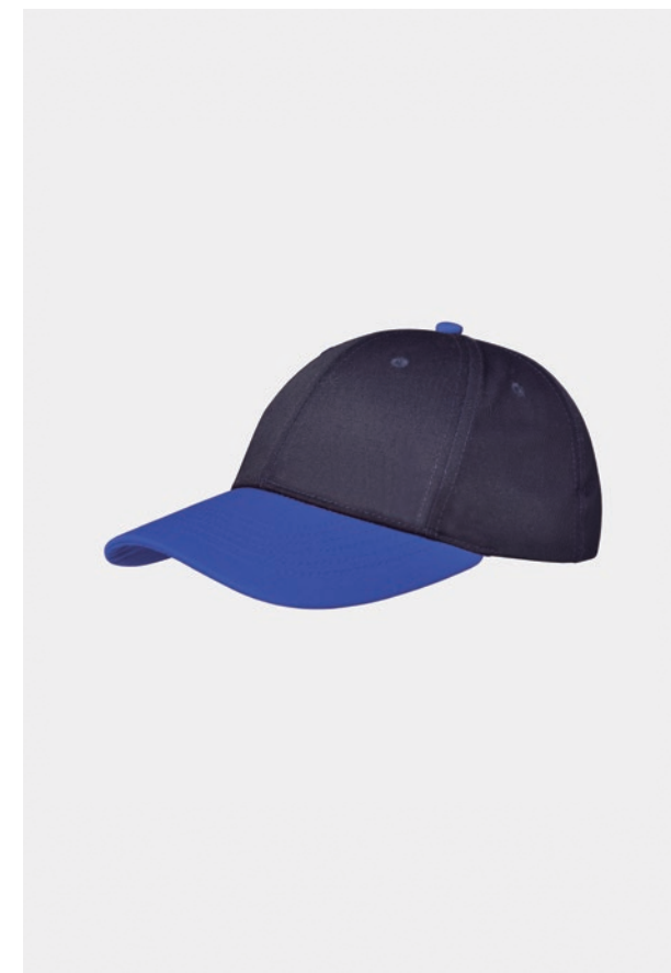
CASQUETTE COMPLÈTEMENT PERSONNALISABLE