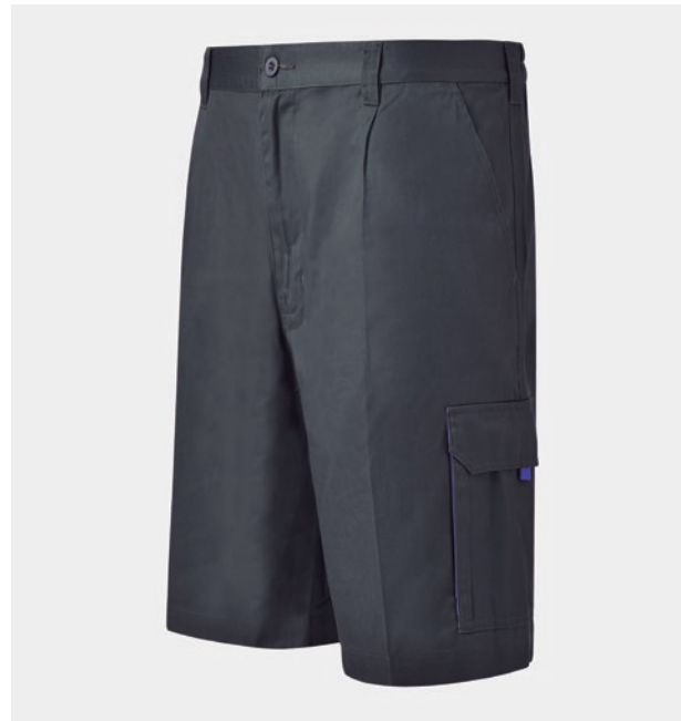
BERMUDA MULTIPOCHES. CEINTURE SANS ÉLASTIQUE