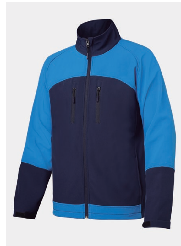
VESTE BICOLORE COL MONTANT ET DOUBLE POCHE SUR POITRINE