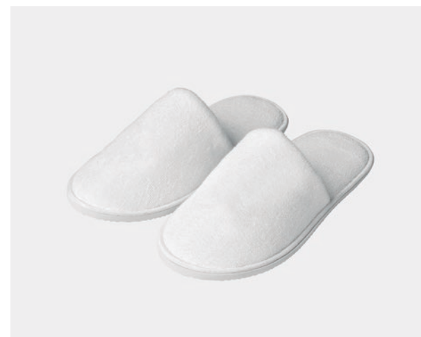
CHAUSSONS SPÉCIAL POUR BAIN